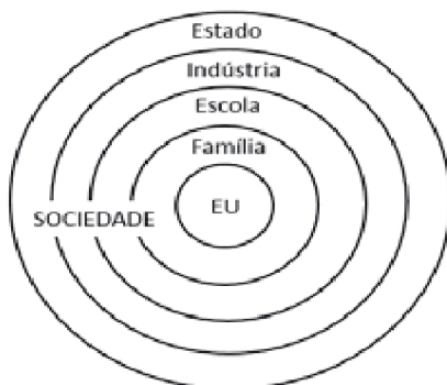
Figura 1. Diagrama do padrão básico de uma visão egocêntrica da sociedade.

Nesse sentido, Elias (2008) refutou algumas certezas da Sociologia de sua época trazendo para a academia, por exemplo, normas de conduta, costumes e transições de modo de ser realizadas em longo prazo. Destaco a refutação do autor que influenciou e tem influenciado algumas teorias sociológicas, na qual o “eu” ocupa um lugar egocêntrico rodeado por estruturas sociais, cunhada na metáfora “camadas da cebola”, explicitada na Figura 1 (Elias, 2008, p. 13-15).